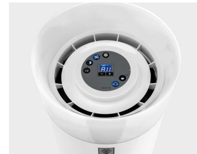
Programmabile per un esercizio completamente automatico