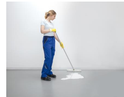
Anche per applicazione manuale