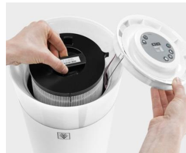
Filtro a carbone, filtro Hepa ed generatore a plasma